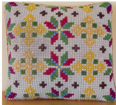
Púðar, útsaumaðir með krosssaum.