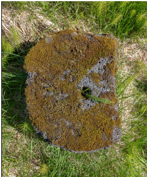
Kvarnasteinninn sem var notaður í vatnsmyllunni frá 1873.