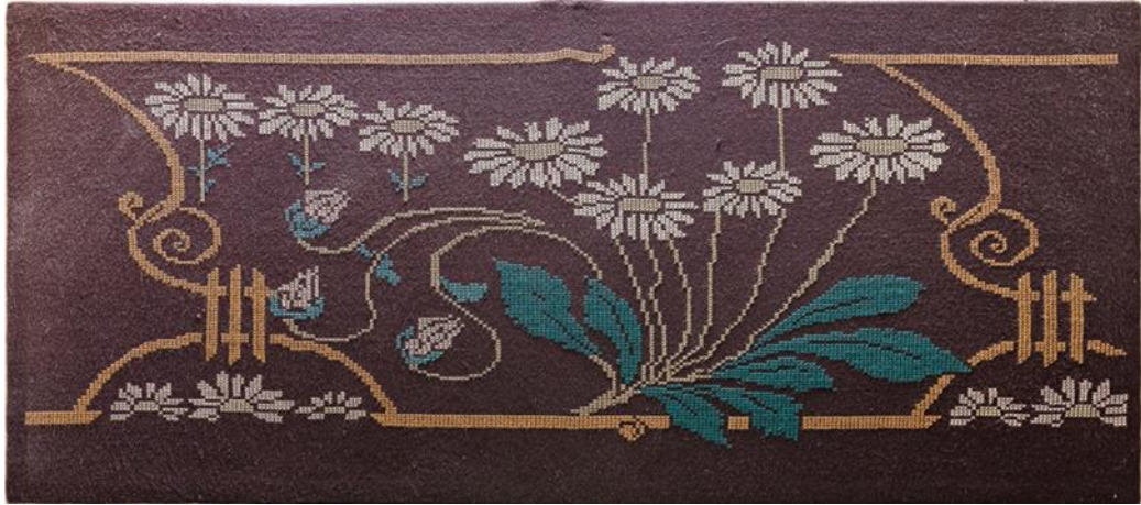
Stór veggmynd, útsaumuð með krosssaum í jafa.