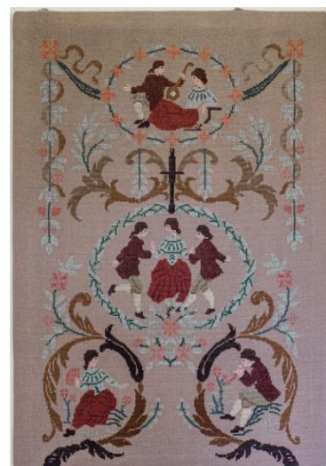
Stór veggmynd, útsaumuð með krosssaum.

Mikið var um hannyrðir hjá þeim mæðgum á Kvískerjum og þær þóttu myndarlegar í höndunum. Mest var unnið úr ullinni sem áður var búið að þvo og þurrka: kembt, spunnið og þrjónað, ofið og saumað fyrir heimilisfólkið. Eflaust hefur takmarkaður tími gefist fyrir útsaum og annað fínerí en einhver þó, þess bera vitni ýmis þráðlistaverk á heimilinu.