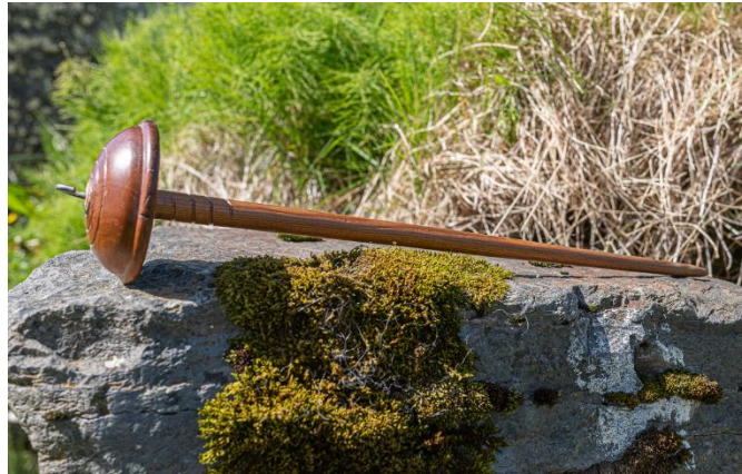
Mynd til vinstri: Kambar. Mynd fyrir ofan: Snælda.