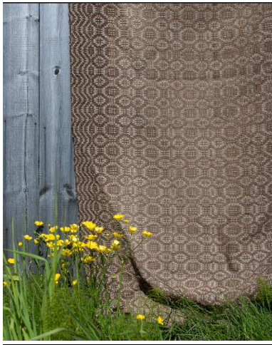
Þrjár myndir fyrir ofan: Dæmi um borðrenninga sem voru ofnir. Mynd til vinstri: Ofin rúmábreiða.