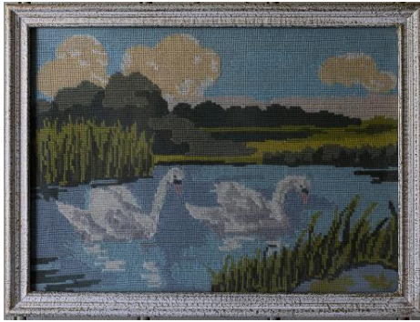
Útsaumuð veggmynd með krosssaum.