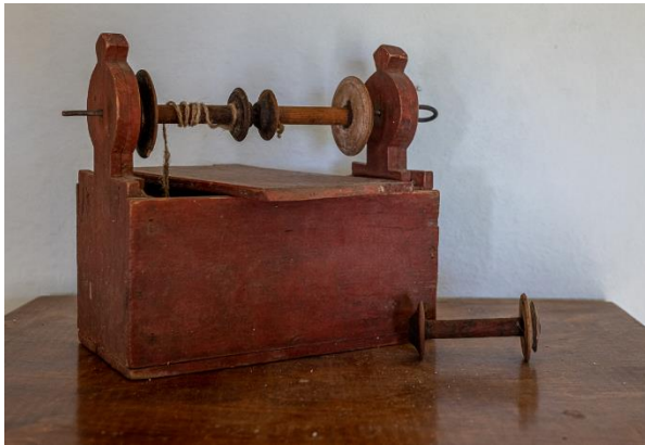
Snældustokkur Guðrúnar eldri, smíðaður af Sigurði Arasyni á Fagurhólsmýri 1915.