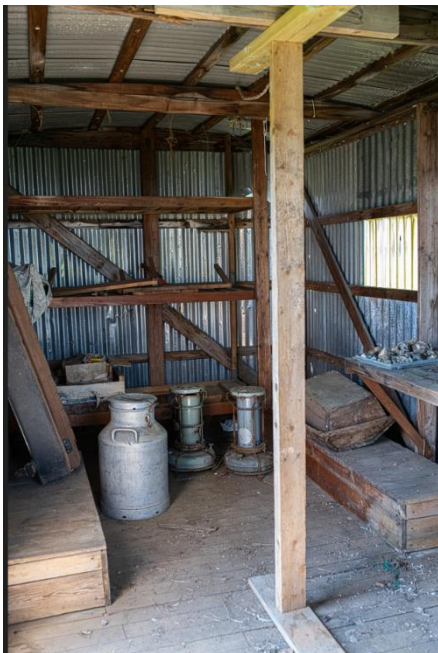
Mjólkurbrúsi og olíuofnar í hjólhýsinu.