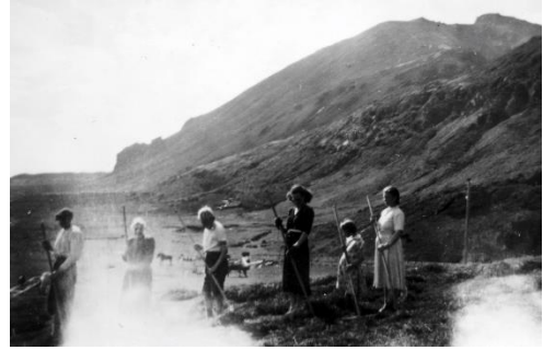
Kvískerjafólk að snúa heyi.

Úr bréfi frá Þrúði 22. júlí 1954 – “Það er nú búið að slá og flytja utan frá Mýri, svo langar þá að reyna að slá svolítið hér fyrir utan, þú trúir ekki hvað ég hlakka til ef væri hægt að sjá fólkið mitt við heyvinnu hér í kring.”