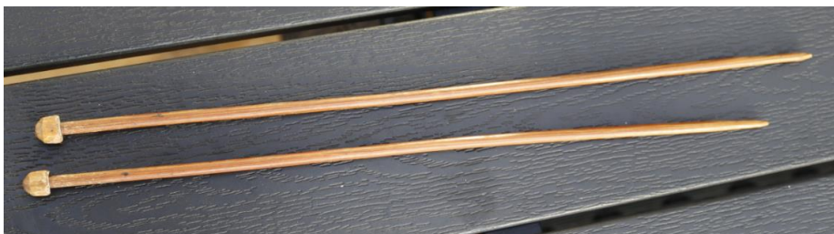
Heimagerðir prjónar. Þessir eru gerðir úr viði en einnig var algengt að gera þá úr bambus.

Kvískerjakonur voru með hringprjónavél og mikið var prjónað af sokkum, húfum og peysum en einnig muna margir eftir fallegum handprjónuðum rósavettlingum eftir Rúnu.