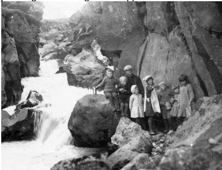
Barnahópur í æfintýraferð.

Mikill munur var á vinnunni hjá þeim mæðgum á Kvískerjum á sumrin og á veturna. Á veturna voru þær við tóvinnu, þrjón, vefnað og sauma en á sumrin voru þær mest að sjá um mat því fólkíð var margt, fyrir utan heimilisfólkið voru oft fjögur til sex börn og jafnvel gestir. Þetta gat farið upp í 20 manns.