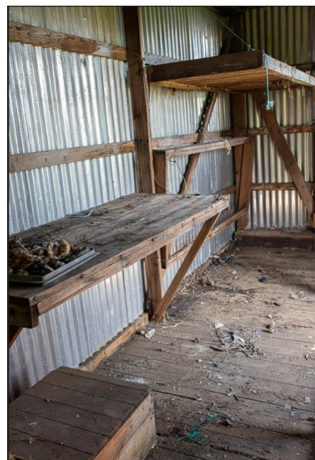
Kojur og borð.