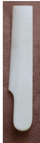
Skafa til að skafa innan úr súrmjólkurfernum.