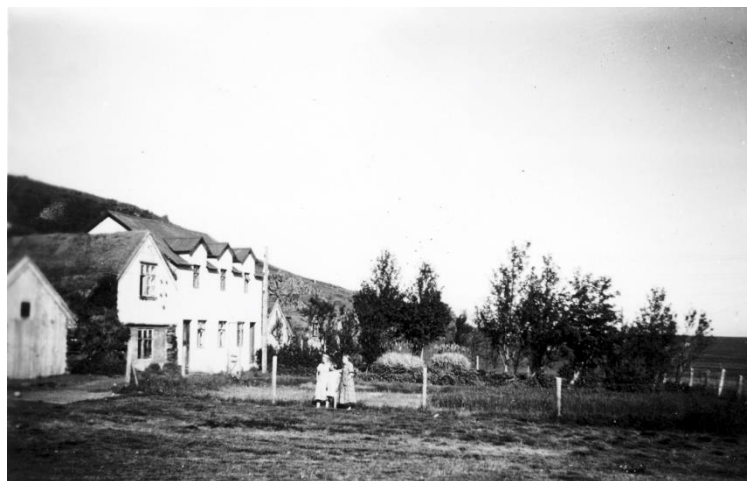
Baðstofan og íbúðarhúsið, og stór garður fyrir framan.

Vestar var stór grænmetisgarður. Þar var ræktað grænkál, salat, rófur og bláar kartöflur, kallaðar Blálandsdrottning - líka rabbarbari.